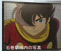
石巻駅構内の写真